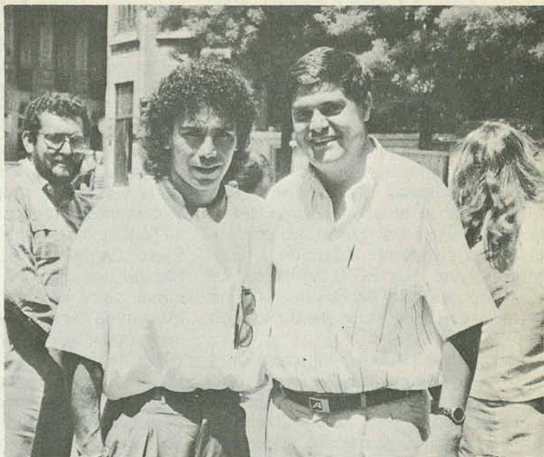
En Madrid, España, con el futbolista mexicano Hugo Sánchez.

todavía adolece de acartabonadas programaciones en sus 2 canales de cobertura nacional. Por cierto que el gobierno de Felipe González, acaba de autorizar la apertura de otros 2 canales, así como de la participación de la iniciativa privada en este importante medio de comunicación.