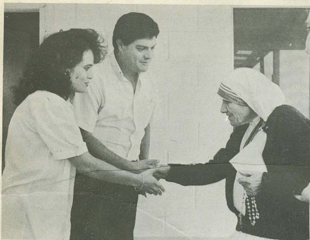
La esposa del autor y él mismo saluda a la Madre Teresa de Calcuta en Tijuana, B.C., México, en junio de 1989. Durante su visita a nuestro país.

La Madre Teresa, como todos ellos, se ha entregado a servir sin límites a una sociedad cada vez más deshumanizada, entregándole su mensaje de paz por todos los confines de la tierra, y prodigando amor a "los más pobres de los pobres", como ella misma lo dice.